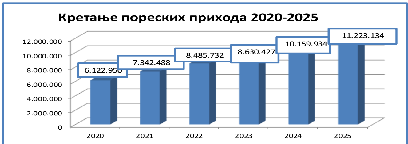
Графикон бр.2 Кретање пореских прихода 2020-2025. године

У наредном графикону дати су преглед кретања пореских прихода у посљедњих неколико година.