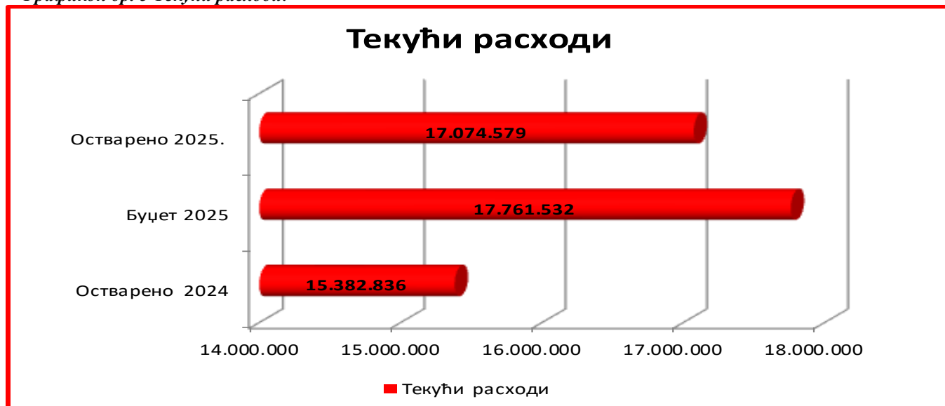
Графикон бр. 5 Текући расходи:

У наредној табели приказано је извршење текућих расхода: