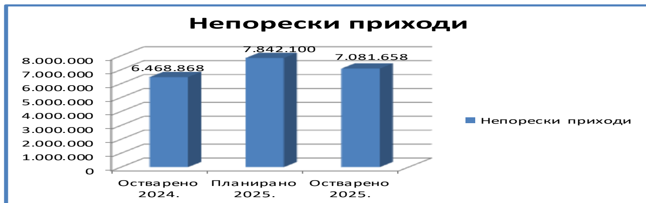
Графикон бр.3 Непорески приходи:

Графикон бр.3 даје приказ кретања извршења непореских прихода у односу на исти период прошле године као и у односу на план буџета за 2025. годину.