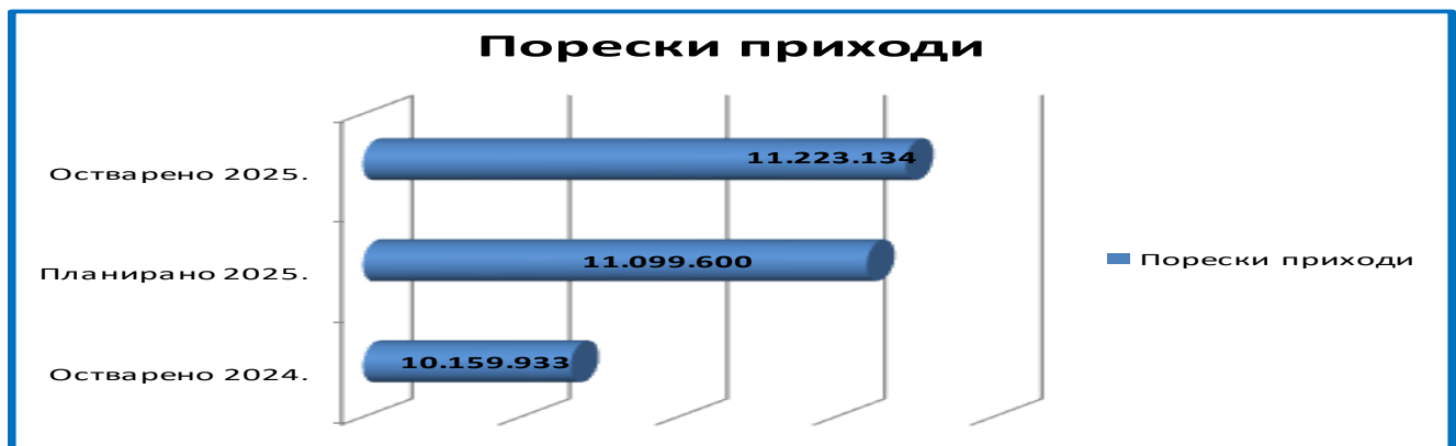
Графикон бр.1 Пореских приходи у односу на исти период прошле године и буџет за 2025. годину:

У наредном графикону дати су преглед кретања пореских прихода у посљедњих неколико година.